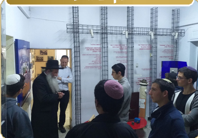
ראש המכון הגרא"מ הלפרין שליט"א בשיעור מסכם לתלמידי התיכון התורני בעזרת הדגמות מעשיות

תלמידי תיכון תורני, שעסקו בתקופה האחרונה, במסגרת לימודי תושבע"פ, בחקר סוגיות של גדרי מעשה וגרמא בהלכה, ביקשו להגיע לביקור במכון ולשמוע שיעור סיכום בליווי הדגמות מעשיות.