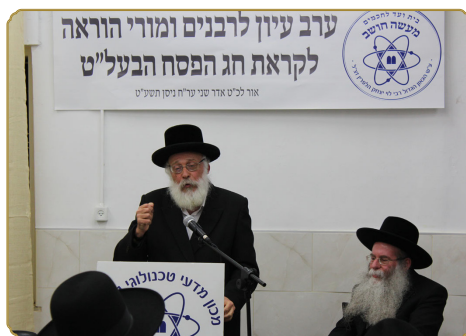
הגאון רבי משה שטיין שליט"א נושא דברים