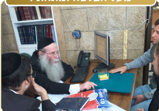
הכיסוי המיוחד לפלטת השבת מוצג ע"י היזמים בפני ראש המכון שליט"א