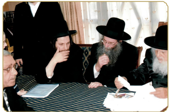
ראש המכון שליט"א, בתוקף תפקידו כראב"ד בד"ץ אונגוואר. במכירת חמץ בע"פ עם כ"ק מרן גאב"ד אונגוואר זצ"ל ויבלח"ט האדמו"ר מאונגוואר שליט"א

בהם בפרך", יכולה להתפרש בשתי פנים ובשני מובנים. בעוד שלפי פשוטו של מקרא בוודאי מדובר בעבודת כפיה מן הסוג הקשה והמפרך ביותר, הרי שמצינו על כך בדברי חז"ל (זוה"ק בראשית כז.) גילויים מופלאים, וכך נאמר שם: "כגוונא דא אמרו מארי מתניתין (כיוצא בזה אמרו בעלי המשנה), וימררו את חייהם בעבודה קשה, בקושיא, בחומר, בקל וחומר, ובלבנים, בליבון הלכתא, ובכל עבודה בשדה, דא ברייתא 1 , את כל עבודתם וגו', דא משנה 2 ".