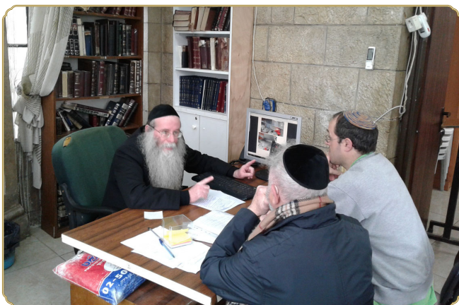
ראש המכון שליט"א בוחן יחד עם היזמים את הערכה החדשנית המיוחדת של פלטת השבת והמיכל שמתחתיה

שני יזמים שונים הגיעו בחודש האחרון למכון, לפגישה עם ראש המכון שליט"א, כדי להציע בפניו רעיונות חדשניים לפלטת השבת המסורתית, ולקבל את הסכמתו ואישורו ההלכתי.